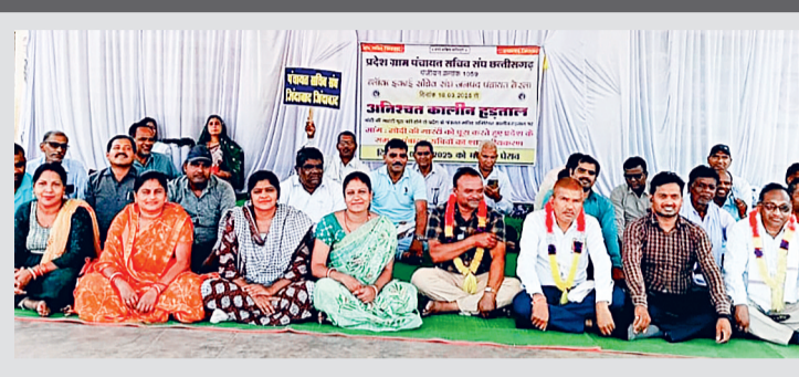
मांग पर बनी सहमति, अनिश्चितकालीन हड़ताल समाप्त

सचिवों ने बताया कि पंचायत एवं ग्रामीण विकास विभाग द्वारा गठित कमेटी जनवरी 2026 तक अंतिम रिपोर्ट प्रस्तुत करेगी और इसके बाद शासकीयकरण किया जाएगा। शासकीयकरण करने से पहले पूर्व में जारी आदेश में निर्दिष्ट वित्तिका व्यय प्रतिपूर्ति हेतु अलग से मार्गदर्शिका जारी की जाएगी। वर्तमान में 15 वर्ष सेवा पूर्ण करने पर हो रहे वेतन सत्यापन विसंगति का सुधार किया जाएगा। आंदोलन अवधि के वेतन की स्वीकृति तत्काल प्रदान किए जाने को लेकर सहमति बनी है।