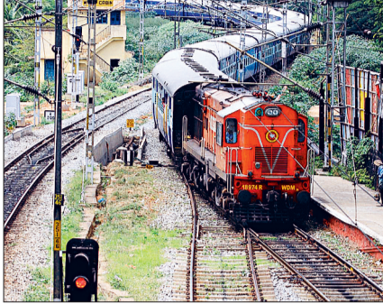
लोकल ट्रेन में बड़ी भीड़

हरिभूमि न्यूज ►► राजनांदगांव रेल लाइन विस्तार के चलते छत्तीसगढ़ से गुजरने वाली लगभग 50 ट्रेनों को कैंसिल कर दिया है। ये ट्रेनें 23 अप्रैल से 6 मई तक अलग-अलग दिनों में नहीं चलेंगी, लेकिन इससे पहले ही ट्रेनों की लेट-लतीफी के चलते यात्रीगण परेशान हो रहे हैं।